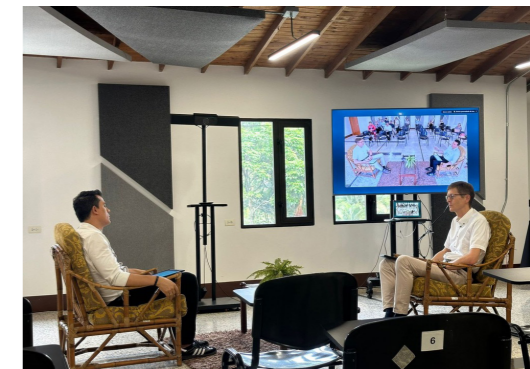
Publiek gesprek over scriptie aan de hand van vragen van de docent