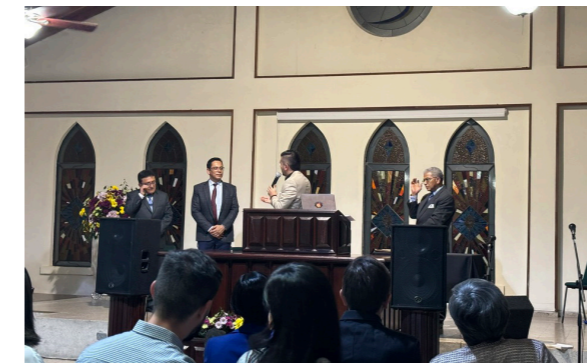
FUSBC 80 jaar

De viering stond vooral in het teken van dankbaarheid: aan God voor Zijn trouw en aan al die mensen die door de jaren heen hun bijdrage hebben geleverd als docent, mentor of op andere manieren. Zelf mocht ik de afgelopen twee jaar ook een steentje bijdragen als docent en mentor. Het is bijzonder om deel uit te maken van deze rijke geschiedenis en te zien hoe FUSBC zegen brengt, in Colombia en daarbuiten.